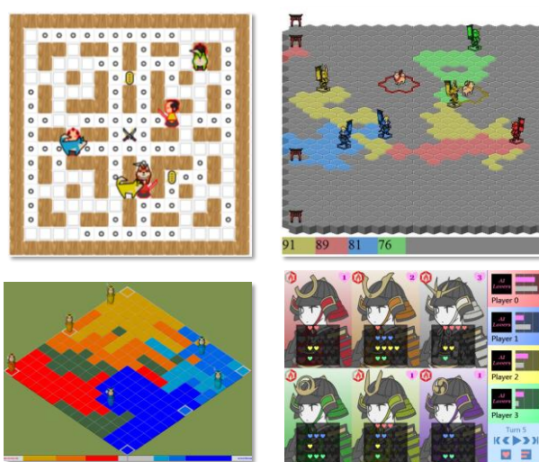
図 2: SamurAI Coding のゲーム画面 (左上から時計回りに 2011, 2012/2013, 2014, 2015 年度)

情報処理学会プログラミングコンテスト委員会では現在、2016 年度についても 2015 年度のゲームを概ね踏襲した題材を検討している。まずは、図 3 に示すようなサンプルや簡単なコードにより、サムライを操ることを楽しんでほしい。慣れてきたら、上記のような評価関数を検討すると良い。